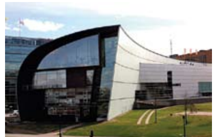
En Finlande, on apprécie et on pratique de nombreuses disciplines culturelles. Les œuvres de musique, de littérature, d'art pictural, de design et d'architecture finlandaises sont aussi connues à l'étranger.

Les foyers finlandais sont composés en moyenne de 2,1 personnes. La part des personnes habitant seuls est de 39,3 %. L'espérance de vie moyenne est pour les femmes de 81,3 ans et de 75,3 ans pour les hommes.