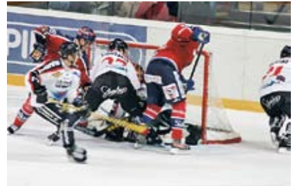
Les Finlandais sont sportifs. Les disciplines favorites sont le golf, le ski, l'athlétisme, la marche nordique et le hockey sur glace, entre autres.

La Finlande est un vaste pays à faible densité de population, situé dans la partie septentrionale de l'Europe. Ce pays, grand par sa superficie, ne compte que 5,3 millions d'habitants : en moyenne 17 habitants au kilomètre carré. Helsinki et son agglomération comptent un million d'habitants et 71 % de la population habite dans les villes.