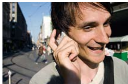
Les Finlandais sont des adeptes des téléphones portables et des ordinateurs. 97 % des Finlandais disposent d'un téléphone GSM. Nokia, le géant de la fabrication des téléphones mobiles, est une entreprise finlandaise.

On encourage la recherche et l'innovation. Dans la plupart des domaines, la Finlande se trouve en tête du